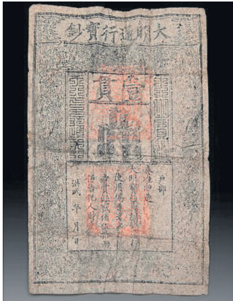
Die skaars 700 jaar oue banknoot uit die Ming-dinastie wat binne-in die borsbeeld ontdek is.

'n Luohan is die Chinese woord vir diegene wat die vier fases van Verligting (Enlightenment) voltooi het en hulle in 'n staat van Nirvana bevind. Die